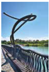
明神湖畔の結いの高欄道